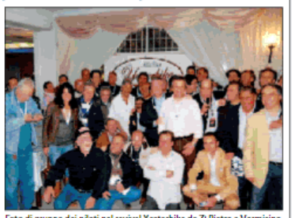
Foto di gruppo dei piloti nel revival Yesterbike da Zi Pietro a Vermicino